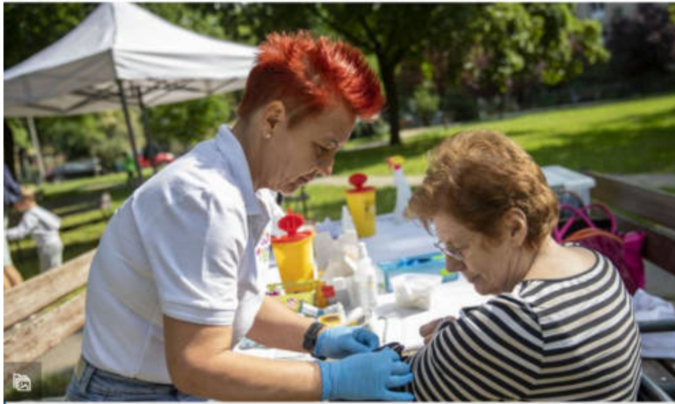
Családi nap a Libakertben

A program része a Szenvedélyes Juniálisnak, melynek célja a különböző függőségek mint folyamatosan erősödő társadalmi probléma tudatosítása a szociális rétegek között; a közösségi csoportok bevonása a közös problémamegoldásba. A szakmai programok mellett többek közt olyan alternatívák népszerűsítése is előtérbe kerül, ahol a fiatalok a számukra megfelelő kikapcsolódási formát megtalálhatják a függőséget okozó területek helyett. Ennek keretében rendeznek családi napokat is.